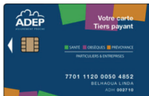
Carte de droits à puce ADEP, mise à jour automatiquement.